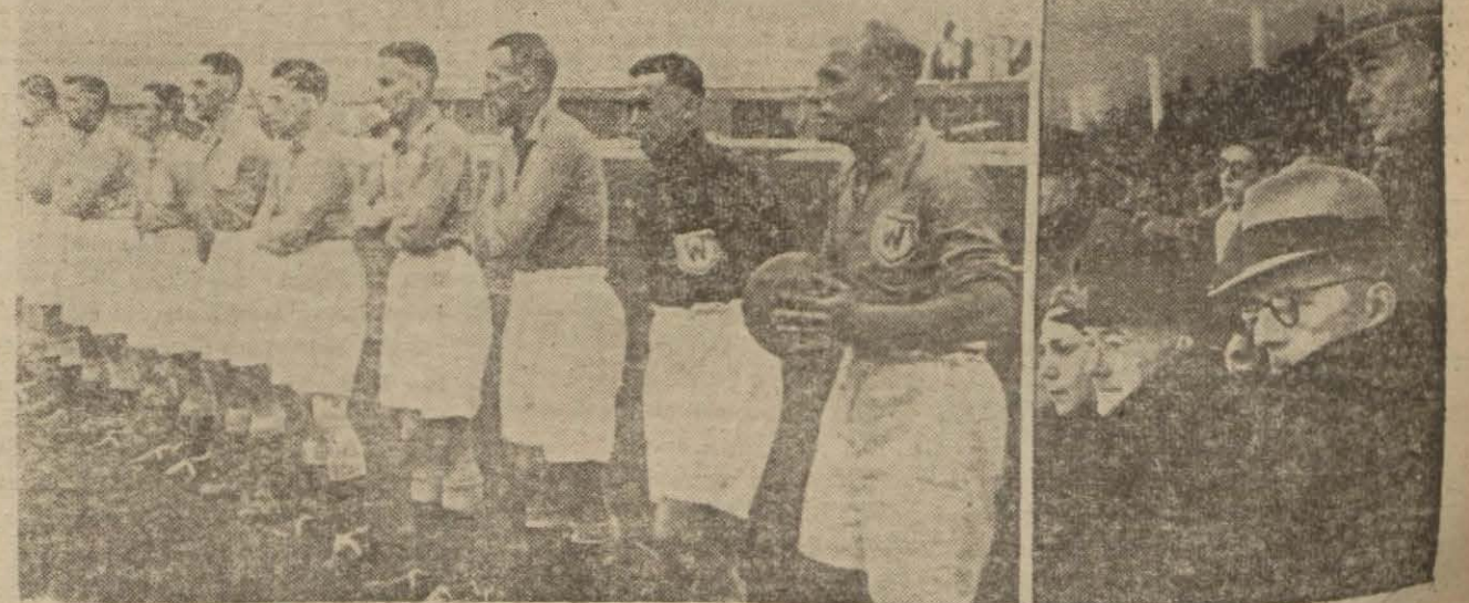
İngiliz takımının Gençler Birliğe yaptığı maçtan iki görünüş: Misafir takım sahada, Harbiye Vahitimiz İngiliz büyük elçisi maçı seyrediyorlar (Xams 6 inci sayfada)

Hususi surette giden spor muharririmiz Ömer Besim bildiriyor