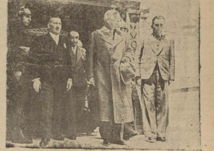
Başvekillimiz tetkik seyahatlerinden birinde Adana, (Hususi) — Başvekilli. kıklar yaptıktan sonra tekrar Mer. miz Dr. Refik Saydamın Adana'ya sine döndüklerini yazmışım. şereflendirdiklerini ve şehirde tet. (Devamı 5 inci sayfada)

Başvekil, Ziraat Bankasının çiftçiye vermekte olduğu kredinin fazlaştırılacağını da beyan etti